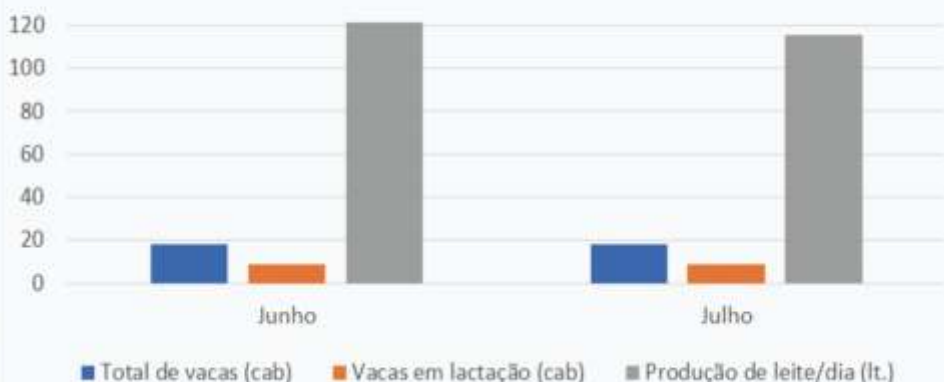
Gráfico 1 - Resultados da produção leiteira utilizando o BRS Capiaçú como volumoso no início do período seco do ano de 2021.