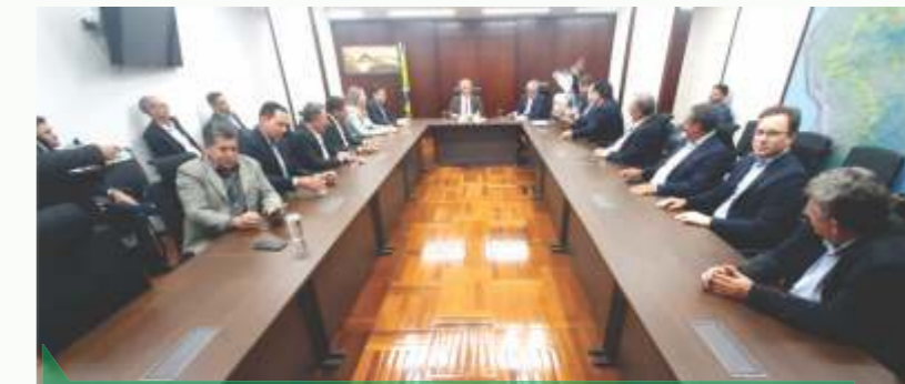
Autoridades cooperativistas realizaram uma reunião emergencial com o Min. da Agricultura, Marcos Montes e apresentaram problemas e sugestões, solicitando medidas urgentes e concretas, visando resolver a problemática do preço do leite.

Além de trabalhar políticas públicas em todas as esferas, por meio dos líderes cooperativistas, o apoio social aos pequenos produtores começa desde a assistência técnica até o auxílio da gestão administrativa da sua propriedade e produção. Esse trabalho tem sido uma prioridade em todos os departamentos da Coopervap, focados na busca de mais oportunidades de negócios, em especial que beneficiem os pequenos produtores, ao facilitar a compra de bens e serviços para a atividade leiteira e, principalmente, lutar por melhores preços.