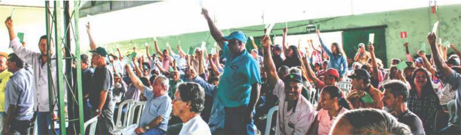
Associados da Coopervap, marcaram presença maciça na Assembleia Geral Extraordinária

Em janeiro, a Coopervap realizou a Assembleia Geral Extraordinária por solicitação do Conselho Fiscal da empresa. O teor da Ordem do Dia foi a interpretação do artigo artigo 78 c/c 35, parágrafo 3º do Estatuto Social, dirimindo a dúvida e trazendo a ratificação aos associados da Coopervap, na perfeita interpretação dos artigos.