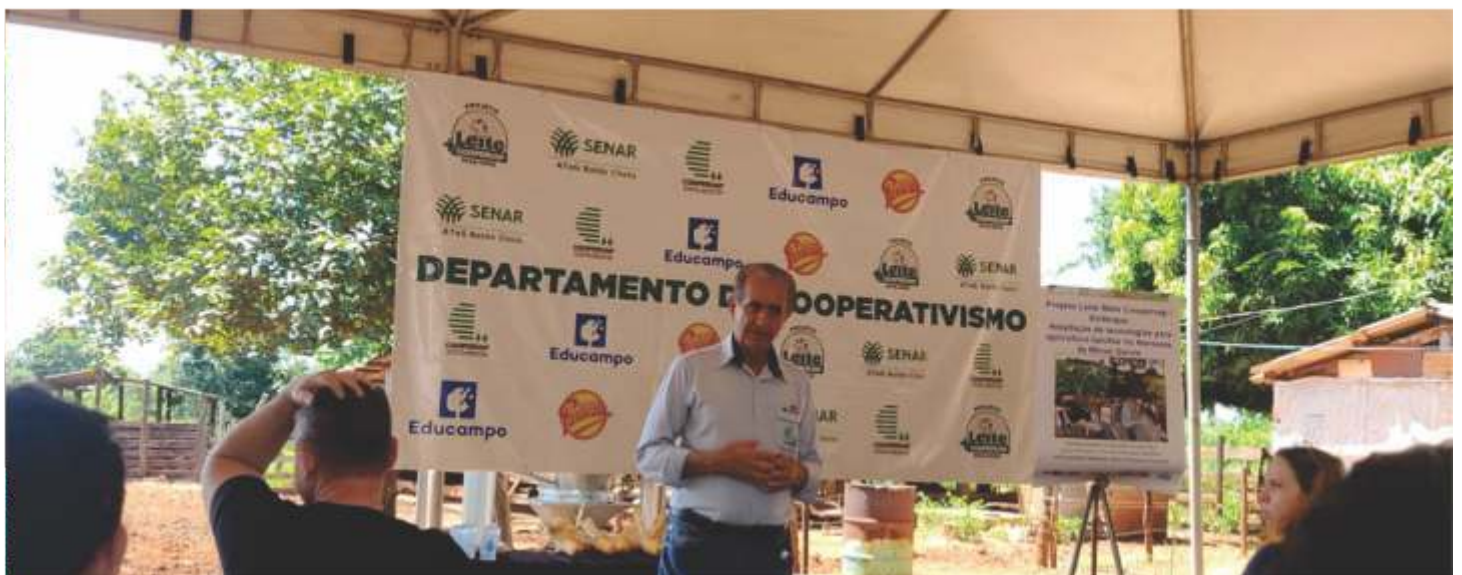
A Coopervap investe fortemente em assistência técnica por meio de projetos como Balde Cheio, Educampo e Leite Mais Coopervap

Os investimentos mais recentes da Coopervap têm sido na modernização dos seus processos, incenti-