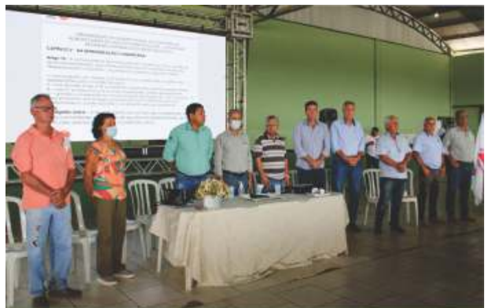
Diretoria e Conselhos da Coopervap atuantes e presentes na assembleia.

O cooperativismo brasileiro é forte e atuante, as assembleias