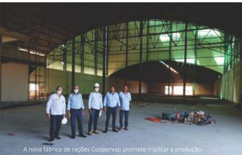
A nova fábrica de rações Coopervap promete triplicar a produção.

vando o crescimento da empresa e a minimização dos riscos. A troca do sistema também foi um passo importante nessa modernização, permitindo um controle eficiente e atendendo as exigências fiscais. E não para por aí, a cooperativa acredita que o sucesso só é possível com o investimento em pessoas e processos, valorizando as experiências, o comprometimento e o trabalho em equipe de todos os seus colaboradores que trazem novas ideias e soluções.