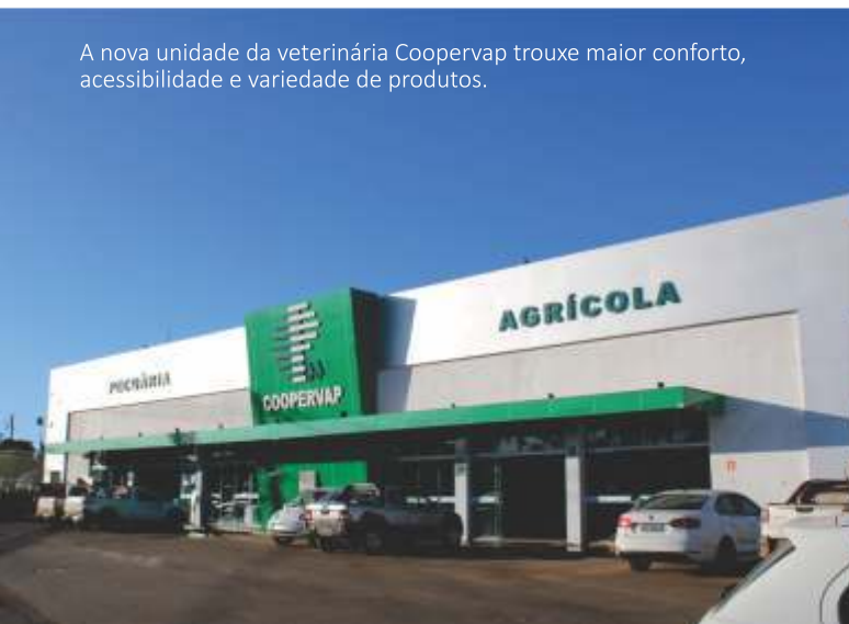
A nova unidade da veterinária Coopervap trouxe maior conforto, acessibilidade e variedade de produtos.

Essas medidas são tomadas com o objetivo de fortalecer os associados, proporcionando um ambiente de trabalho digno, reconhecendo esforços e comercialização justa e atenta ao mercado mundial.