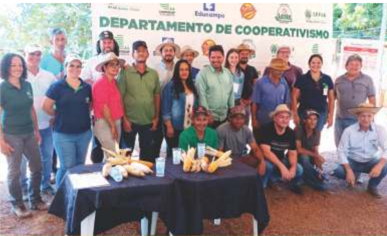
Vários associados da região, se reuniram para acompanhar as palestras

A produção de milho para silagem foi tema do Dia de Campo, realizado no P.A. Herbert de Souza, e reunião técnica, realizada em Cristalina nos dias 07 e 08 de fevereiro. Nos eventos, foram apresentadas aos agricultores tecnologias adaptadas para a agricultura familiar nas regiões.